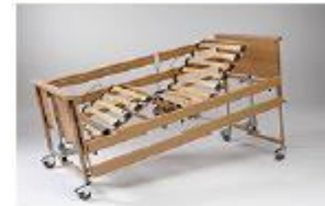
Mecanismo eléctrico de ajuste de altura

Carga máxima de 185 kg, estrado de 4 secções com mecanismo eléctrico para articulação