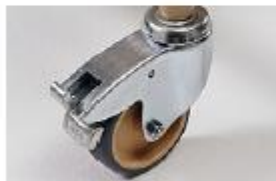
Rodízios de alta qualidade e robustez

Espaço livre na zona inferior da cama de acesso ao elevador