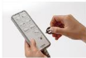
Comando eléctrico com função de bloqueio central